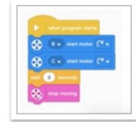
Screen Shot 2021-0...AM.png